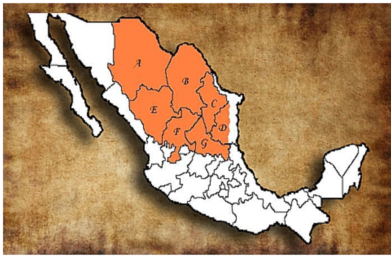
Il Nuovo Regno di León, schematizzato sulla divisione politica odierna della Repubblica Messicana.